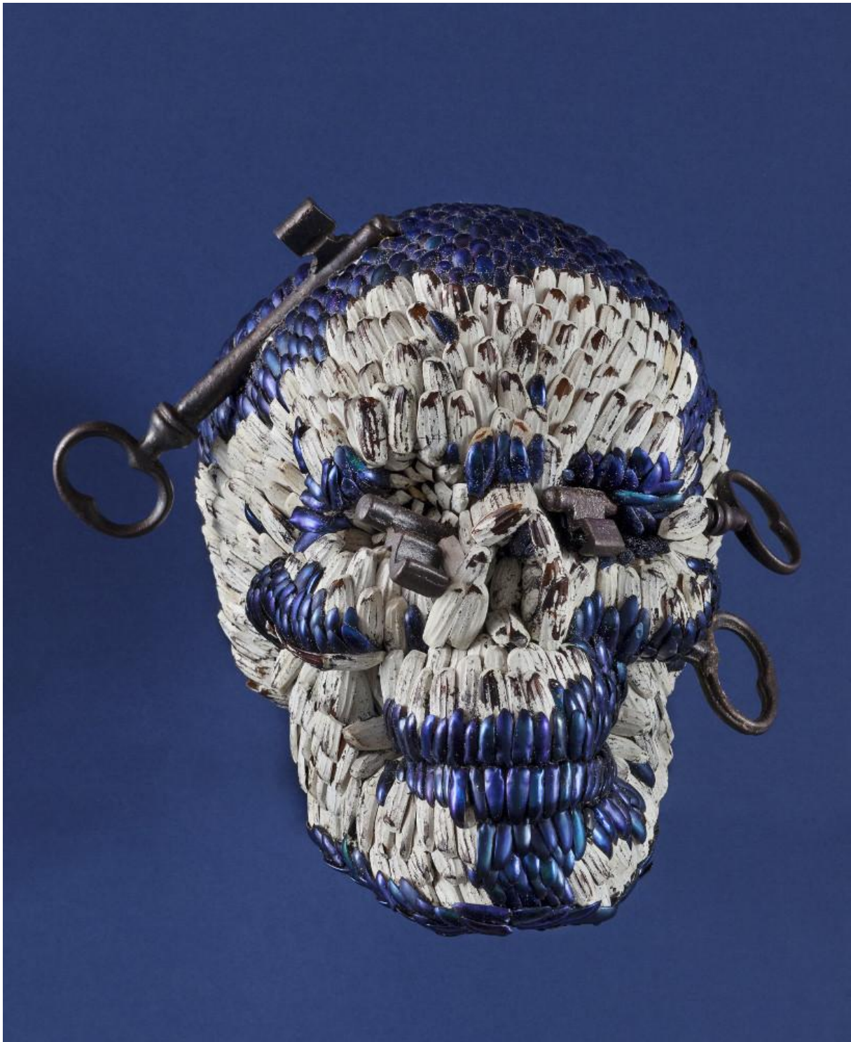
Figure 5 : Jan Fabre (né en 1958), Skull with the Keys of Hell [crâne aux clés de l'Enfer], 2013, ailes de coléoptères-bijoux, polymères, fer, 23x21x20 cm