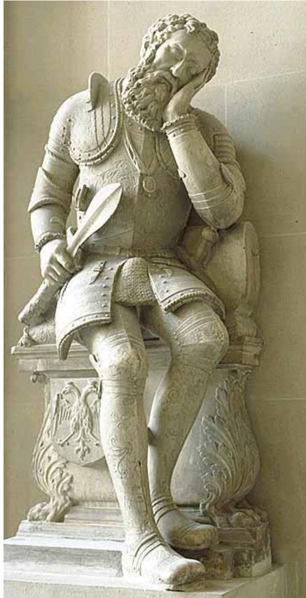
Figure 2 : Pierre Bontemps, Tombeau de Charles de Maigny (mort à Paris en 1556), Capitaine des gardes de la porte du Roi. Fabrication : Paris. Commandé par contrat du 24 juin 1557 - Musée du Louvre, Département des Sculptures.