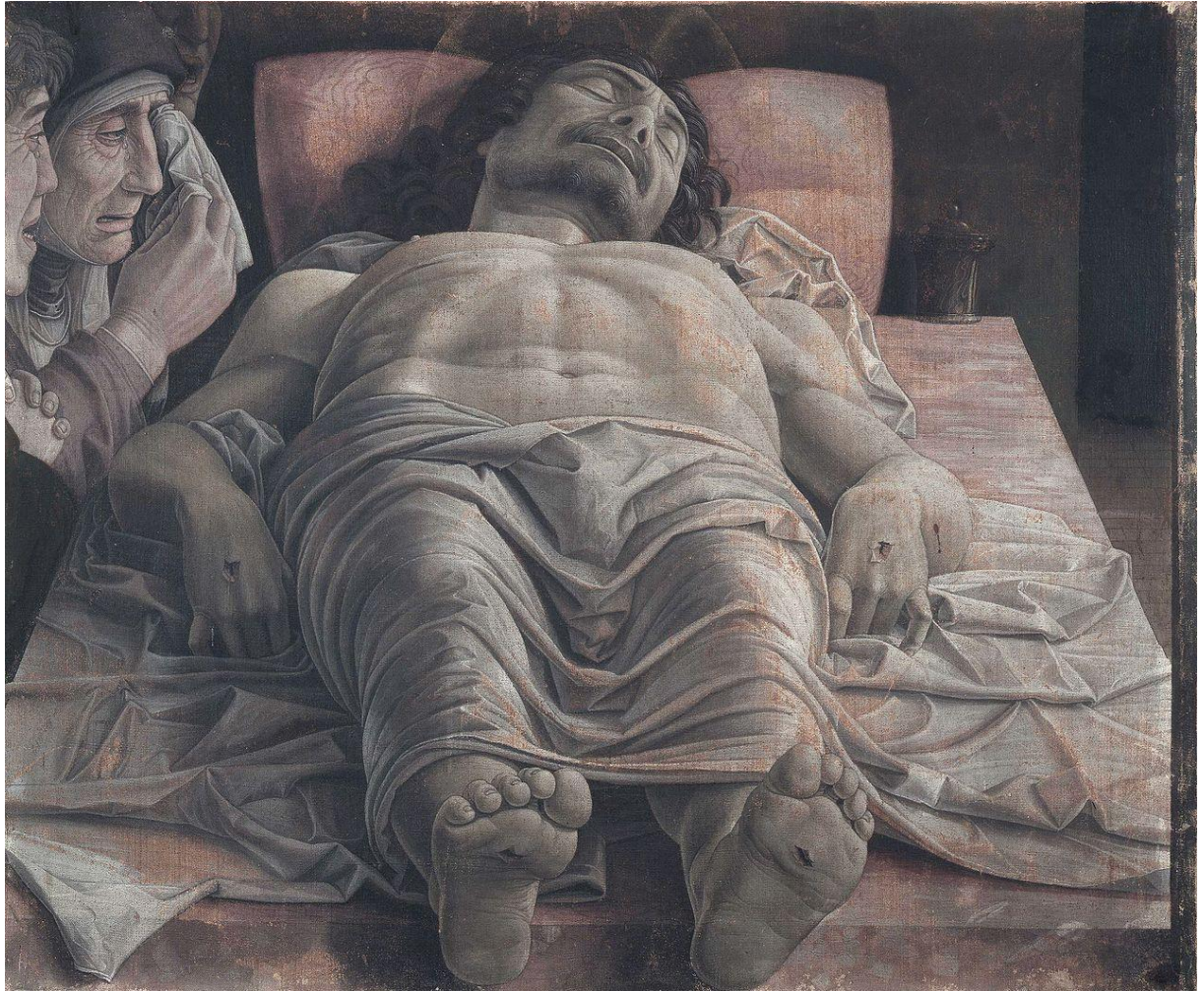
Figure 1 : Andrea Mantegna (1431-1506), Lamentation sur le Christ mort , v. 1480, tempera à la colle, 68 x81 cm. Milan, Pinacothèque de Brera.